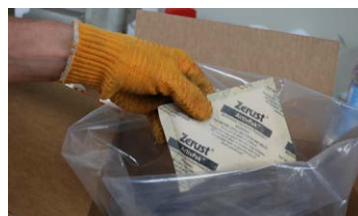
Paquets VCI à action rapide ActivPak®