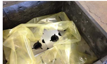
Sac à soufflets VCI Zerust