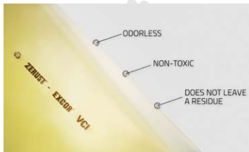
Pellicule VCI Zerust