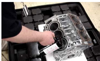
Revêtements protecteurs par pulvérisation d'huile VCI Zerust