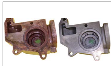
Résultats de l'antirouille Zerust