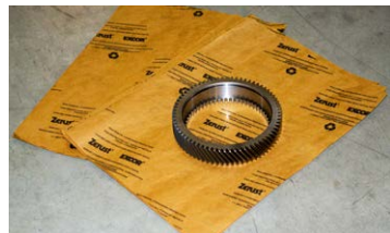
Feuilles de papier Kraft VCI Zerust