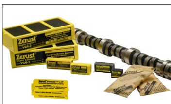
Diffuseurs de vapeur VCI Zerust